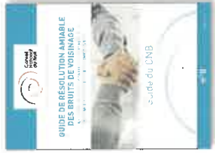
Pour en savoir plus : Amiable des bruits de voisinage - mai 2020. https://www.bruit.fr/maires/particuliers/Ressources/Guides/Cnb/guide-cnb-resolution-amiable-mhb.pdf

Le maire doit fournir aux intéressés les coordonnées des conciliateurs de justice, ainsi que leurs horaires de permanence s'ils en font la demande ( et. www.conciliateurs.fr ).